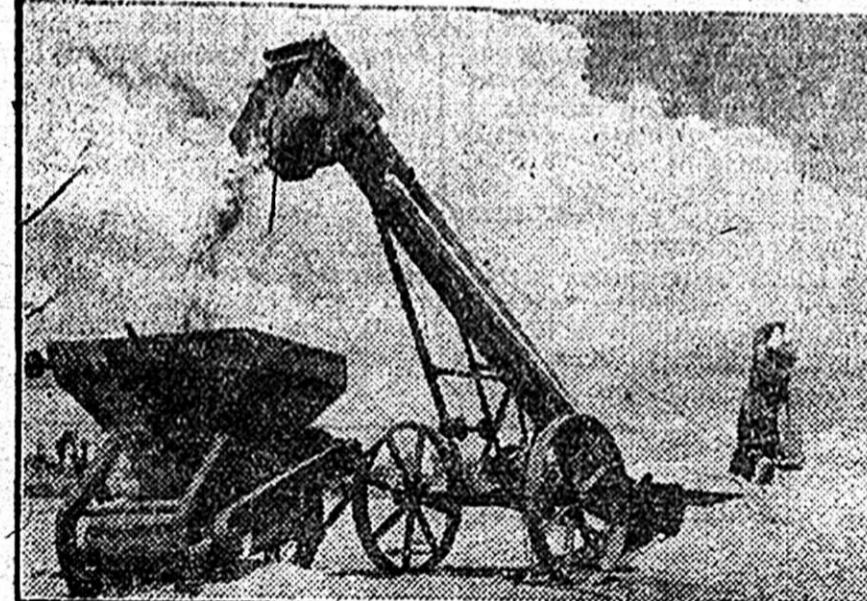
A szovhozokban és kolhozokban speciális gépek segítségével végzik el a gabona szárítását és tisztítását. Egyre több helyen állítanak fel magászórókat, amelyek óránként 10—12 tonna magot forgatnak meg és ezzel lehetővé teszik a nedvességtartalom gyors csökkenését.