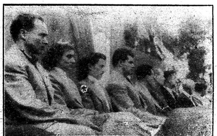
Olimpikonjaink a zalaszentgróti Ünnepi Vásáron. Balról a harmadik Keleti Agnes olimpiai bajnok.