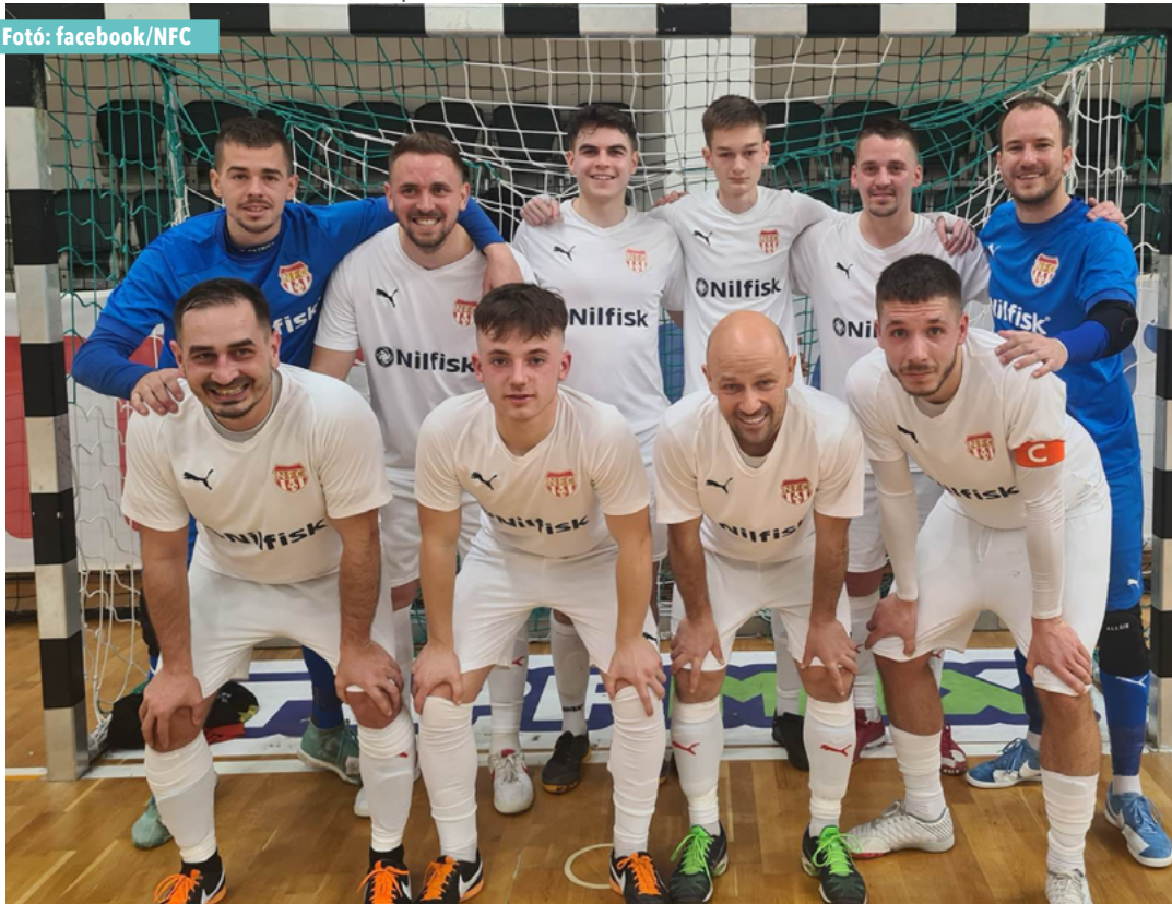
A Nagykanizsai Futsal Club Szombathelyen biztosította be felsőházi tagságát

Haladás VSE II (3.) - Nagykanizsai Futsal Club (6.) 3-4 (2-2)