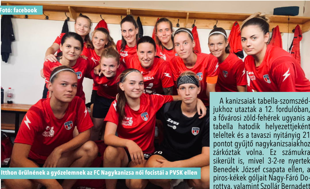
Itthon örülnének a győzelemnek az FC Nagykanizsa női focistái a PVSZK ellen