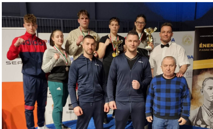
Az ökölvívó Énekes István Emlékversenyen a kanizsai boksizók végül négy érmet szereztek

A fővárosi Énekes-emlékversenyről a Kanizsa Box Klub ökölvívói szép eredményekkel térhettek haza, a mostani hétvégén pedig gálát követhetnek nyomon a sportág rajongói.