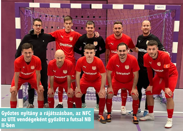
Győztes nyitány a rájátszásban, az NFC az UTE vendégeként győzött a futsal NB II-ben

A felsőházi rájátszást öt induló-ponttal kezdő Újpesti TE otthonában győzött a futsal NB II Nyugati csoportjában a Nagykanizsai Futsal Club legénysége, így ennél jobb rajtról nem is álmodhattak volna a kanizsaiak.