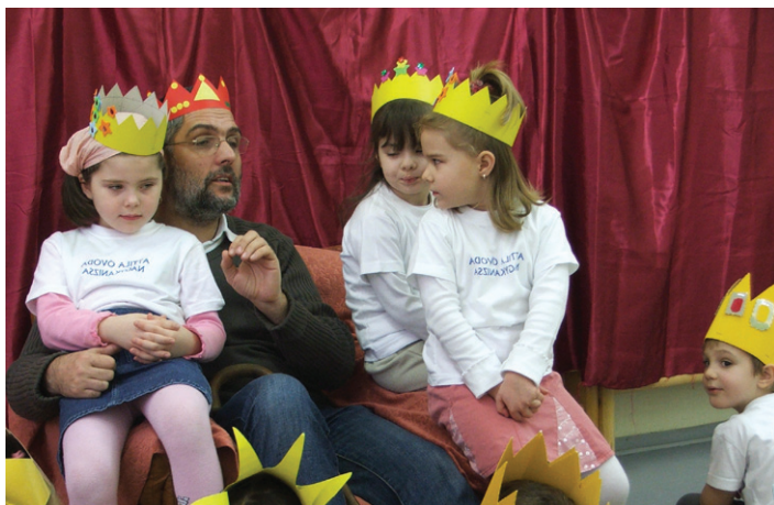
A meseszeretet és a magyarságtudat alakítása, megőrzése jegyében zajlott az Attila Óvoda Mesetarisznya nevű programja, melynek során az óvoda névadójára, Attilára, a hunok királyára emlékeztek.