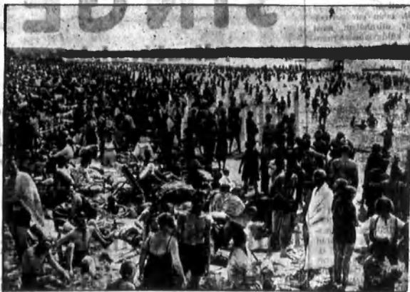
Kánkula a tengerparton.