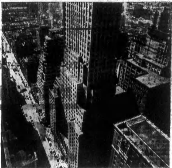
Modern Babel. (Részlet Newyork felhőkarcoló-pályafelől.)