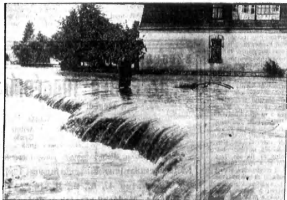
A lengyelországi Árvíz-katasztrófa. A Dunajecz előlőtte Wojnicz várost.

(Nyomatott a lap tulajdonos Közgazdasági R-T. Gutenberg Nyomda és Dézslai László Vállalata Kőnyomdájában, Nagykiszán. (Feladás Bizletvezető: Zalai Károly.)