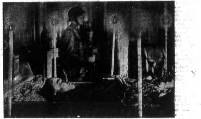
Dollus a ravatlon.

Lapunk úbróhirdetésen keresztül a napokban egy jól szitult nagykenizsi újjalant írásbeli ajánlatokat kért egy vállalat szerezett állásra. Szép kértés jellegré. Sok pályázat érkezett, de beismerték csak két egy érdekel. Egy ajánlatot nem nevezett írás,