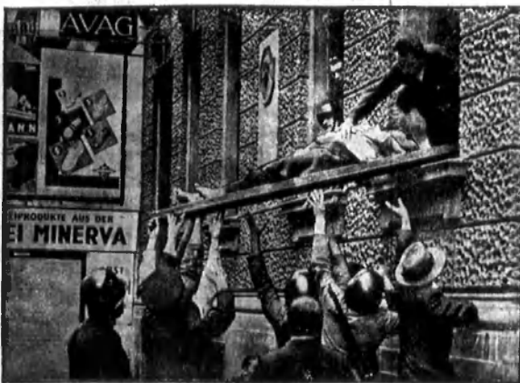
Július 24-ike Bécsben.

Így multak a napok, de nem volt egy peronyl nyugta, mindenütt ki-