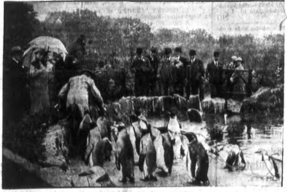
Királyi vendégek a pingvinek közt. Az angol király és felesége skóciai útjában látogattak tettek az edinburgi állatkertben.

Felcélzó kiadó: Zalai Károly, Int. ruban telefon: Nagykonizsai P. sz. szám