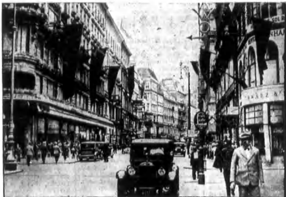
Oyászólogók Bécsben a Körtnerstrassán.