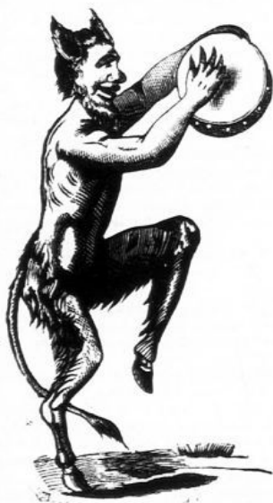
Plutó fia Eszteregnyén.