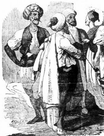
A szerajzevi városi tandes.