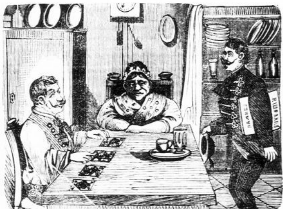
A végrehajtó és a falusi koresmáros.