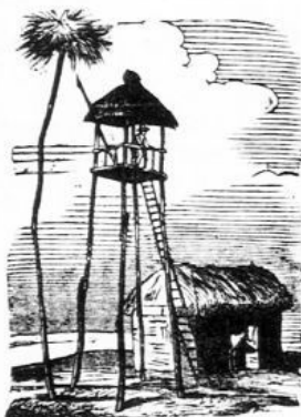
Török katonai őrház.